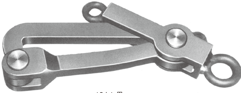
10トン用 Type 10 ton