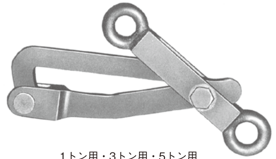
1トン用・3トン用・5トン用 Type 1・3・5 ton